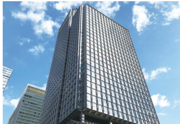
新丸の内ビルディング[東京都]

セメントの代名詞である 普通ポルトランドセメントは、 コンクリート工事やセメント製品など、 その用途は多岐にわたります。 我々は高品質のセメントを 安定してお届けします。