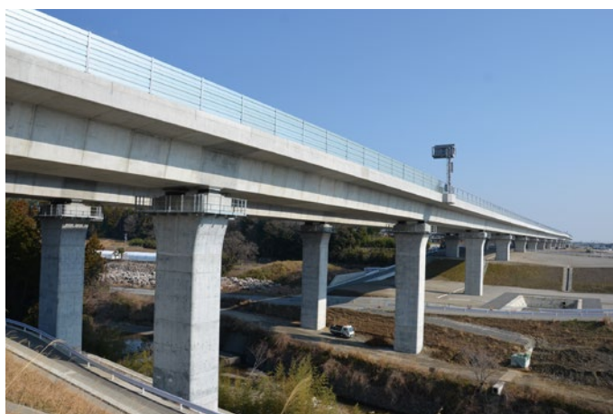
新名神高速道路 鈴鹿高架橋

早期強度が高く、普通ポルトランドセメントの7日強度がほぼ3日で得られます。 工期短縮が必要な各種工事や寒中工事、道路舗装工事をはじめ、プレストレストコンクリート、コンクリート製品などに幅広く利用されています。