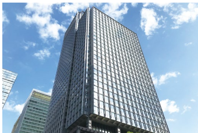
新丸の内ビルディング

普通ポルトランドセメントは、 単に「セメント」の愛称で親しまれている、 最も一般的なセメントです。 その優れた品質は、一般の土木・ 建築工事をはじめ、コンクリート製品や 左官製品など、各方面に幅広く 利用されています。