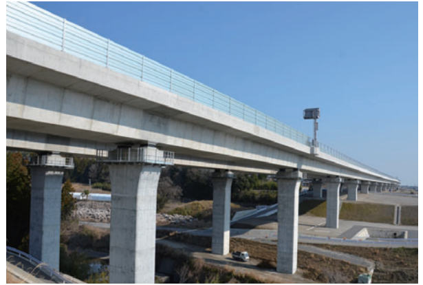
新名神高速道路 鈴鹿高架橋 [三重県]

初期強度発現に優れる 早強ポルトランドセメントは、 工期短縮が必要な各種工事や 寒中工事をはじめ、 プレストレストコンクリート、 コンクリート製品などに 広く利用されています。